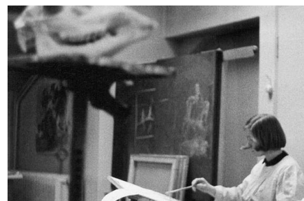
Im Studio für künstlerisches und wissenschaftliches Zeichnen, Universität Münster 1964