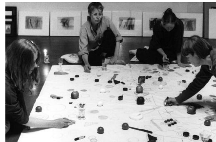
Projekt "Malmahlzeiten" in meinem Atelier in Berlin 1986