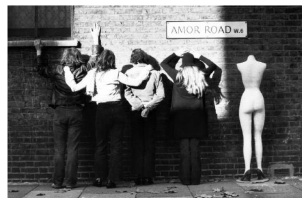
Amor Artists' Collective, 4 Amor Rd. W6, London 1971