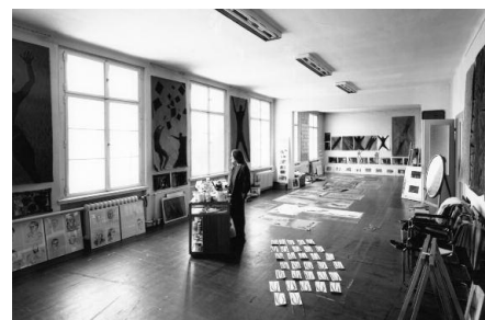
Im Atelier in Berlin 1985, Foto Friedhelm Hoffmann