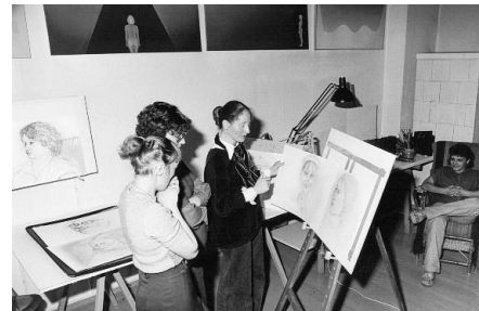
"Frauen aus einem Mietshaus im Wedding", Berlin 1978