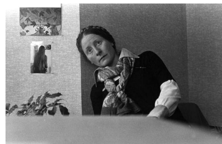
In meiner Wohnung, San Francisco 1979, Selbstporträt