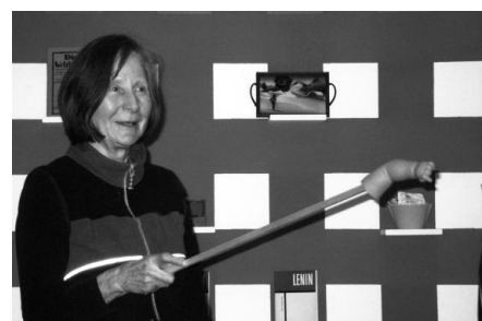
"Alles was bei mir rot ist muss weg", Versteigerung im Haus am Kleistpark Berlin 2008