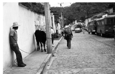
In Tepoztlán, Morelos/Mexico 1979-80