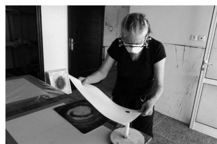
Arbeit an "Welt in Flammen", Ifitry/Marokko 2012