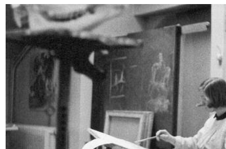
Im Studio für künstlerisches und wissenschaftliches Zeichnen, Universität Münster 1964