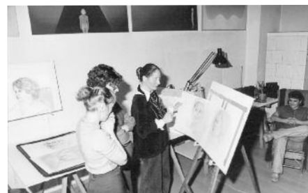
„Frauen aus einem Mietshaus im Wedding“, Berlin 1978