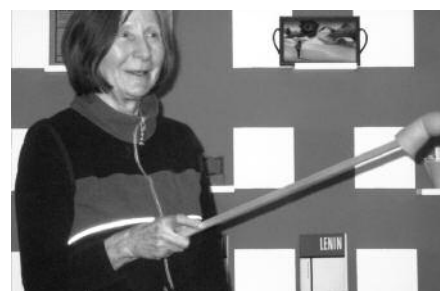
"Alles was bei mir rot ist muss weg", Versteigerung im Haus am Kleistpark Berlin 2008