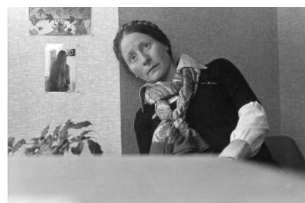
In meiner Wohnung, San Francisco 1979, Selbstporträt