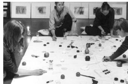
Projekt "Malmahlzeiten" in meinem Atelier in Berlin 1986