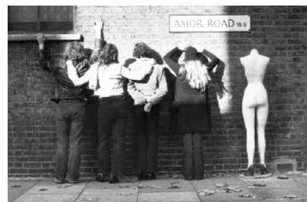
Amor Artists' Collective, 4 Amor Rd. W6, London 1971