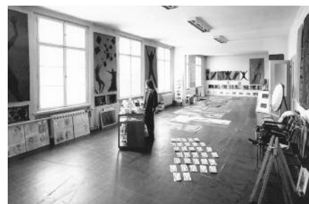
Im Atelier in Berlin 1985