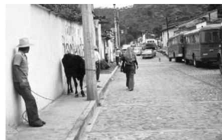
In Tepoztlán, Morelos/Mexico 1979-80