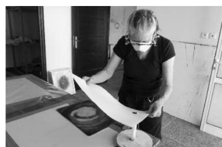
Arbeit an "Welt in Flammen", Ifitry/Marokko 2012