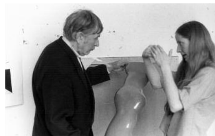
Mit Alexander Camaro, Hochschule der Künste Berlin 1969, Foto Altrud Barnbrock