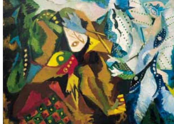
Ernst Wilhelm Nay